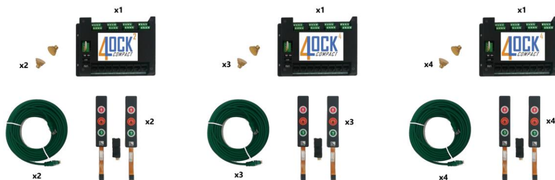
15KIT00041 due porte